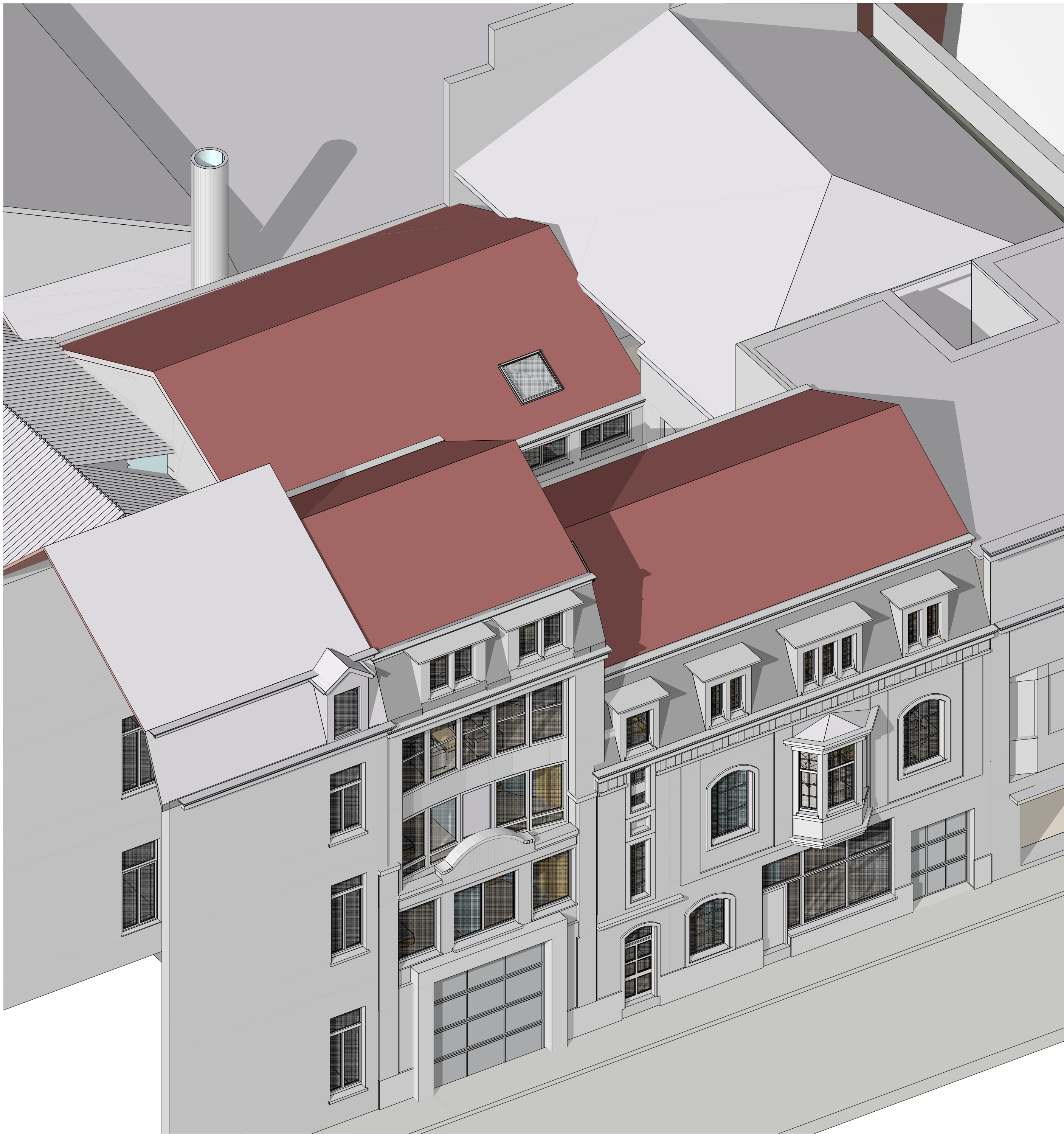
axonométrie rue 1:100